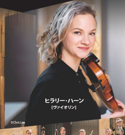
ヒラリー・ハーン [ヴァイオリン]