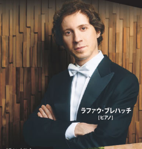
ラファウ・ブレハッチ [ピアノ]