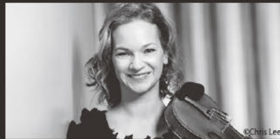
ヒラリー・ハーン (ヴァイオリン) Hilary Hahn, Violin

エストニア人のグラミー賞受賞指揮者パーヴォ・ヤルヴィは今日最も著名な指揮者の一人である。2004年よりドイツ・カンマーフィルハーモニー管弦楽団の芸術監督となり、2024年に就任20周年を迎える。同団とはペーターヴェン、シューマン、ブラームスの管弦楽曲全曲の上演と録音を成し遂げたほか、最近のハイドンのプロジェクトの後、シューベルトに焦点を当てて掘り下げるプロジェクトを開始する。現在、チューリッヒ・トーンハレ管弦楽団の音楽監督、エストニア祝祭管弦楽団の創立者・芸術監督。2015年からNHK交響楽団の首席指揮者、2022年9月からは名誉指揮者となっている。