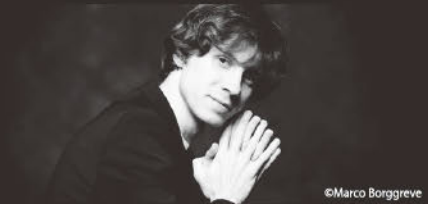
ラファウ・ブレハッチ (ピアノ) Rafal Blechacz, Piano

3度にわたるグラミー賞受賞、明快で華麗な演奏、非常に幅広いレパートリーに対する自然体の解釈、ファンとの一体感ある結びつきにより名声を博している。現在、シカゴ交響楽団初のアーティスト・イン・レジデンスとして3年目であり、ニューヨーク・フィルハーモニックのアーティスト・イン・レジデンス、ジュリアード音楽院の客員アーティストを務めている。デッカ、ドイツ・グラモフォン、ソニーから出たアルバムすべてがビルボード・チャートのトップ10に初登場し、3枚がグラミー賞を受賞している。