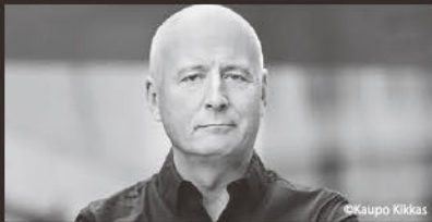
パーヴォ・ヤルヴィ (指揮) / ドイツ・カンマーフィル芸術監督 Paavo Järvi, Conductor Artistic Director of The Deutsche Kammerphilharmonie Bremen

エストニア人のグラミー賞受賞指揮者パーヴォ・ヤルヴィは今日最も著名な指揮者の一人である。2004年よりドイツ・カンマーフィルハーモニー管弦楽団の芸術監督となり、2024年に就任20周年を迎える。同団とはペーターヴェン、シューマン、ブラームスの管弦楽曲全曲の上演と録音を成し遂げたほか、最近のハイドンのプロジェクトの後、シューベルトに焦点を当てて掘り下げるプロジェクトを開始する。現在、チューリッヒ・トーンハレ管弦楽団の音楽監督、エストニア祝祭管弦楽団の創立者・芸術監督。2015年からNHK交響楽団の首席指揮者、2022年9月からは名誉指揮者となっている。