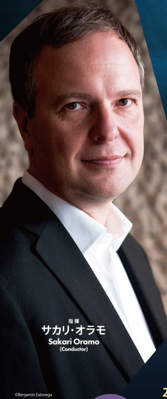
指揮 サカリ・オラモ Sakari Oramo (Conductor)